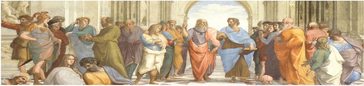
School van Athene, fresco van Rafaël Santi 1509-1510 in de Stanza Della Segnatura, Rome.